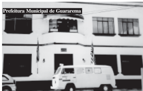
Esta é a sede do poder executivo da cidade, aqui a prefeita manda e fala alto...