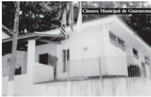
... Esta é a sede do poder legislativo da cidade, aqui a prefeita sonha em voltar a falar mais alto...