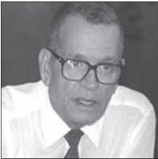
Waldemar foi o prefeito que mais fez obras na cidade

Poucos foram os prefeitos que ficaram na história da cidade, mas, por quê? Porque ousadia é apenas para poucos e foram poucos que alcançaram êxito. Na história da cidade, Waldemar Costa Filho foi o que mais ousou, obras como da Rodovia Mogi-Bertioga, Rodovia Mogi-Dutra, construção do prédio da Prefeitura, do prédio do Fórum, do INSS, da Justiça do Trabalho,