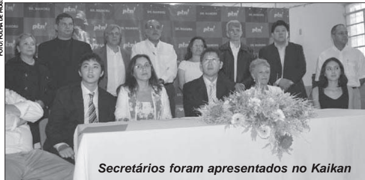
Secretários foram apresentados no Kaikan