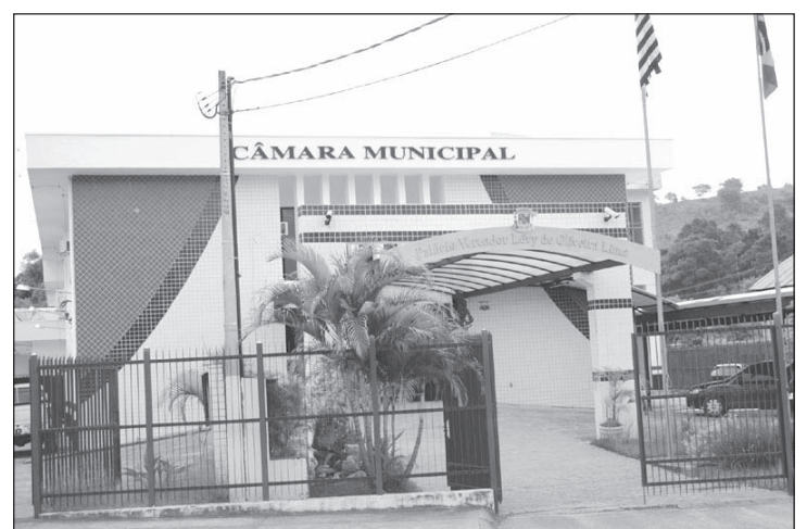
Sede da Câmara foi o local escolhido para diplomação