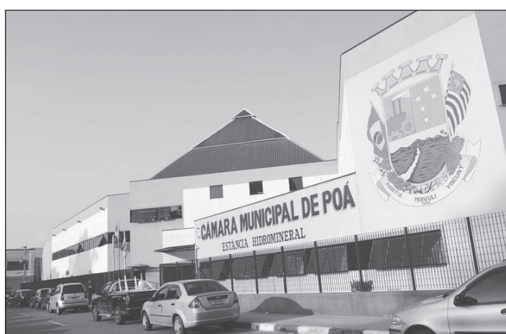
Audiência pública foi realizada na Câmara Municipal de Poá

Compareceram todos os pré-candidatos do PSB a vereador, filiados, o pré-candidato a prefeito Genésio Severino (DEM) e a deputada estadual Heroilma Tavares (PTB), que veio manifestar o apoio aos pré-candidatos da legenda e também ao ex-prefeito, Genésio Severino.